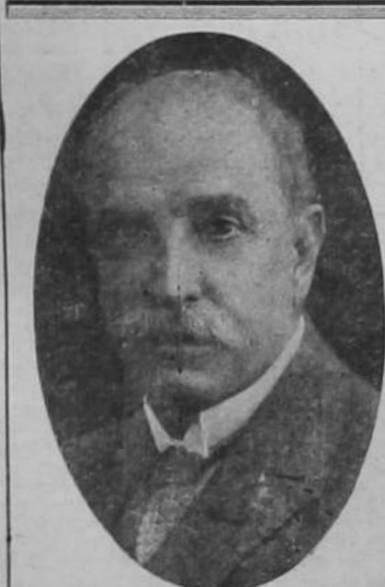
LIC. D. RICARDO JIMENEZ O. ilustre ex-presidente de la República, quien hoy cumple 81 años de edad.

Enviará el departamento de agricultura americano una comisión de expertos a nuestro país a estudiar las condiciones para iniciar esos cultivos